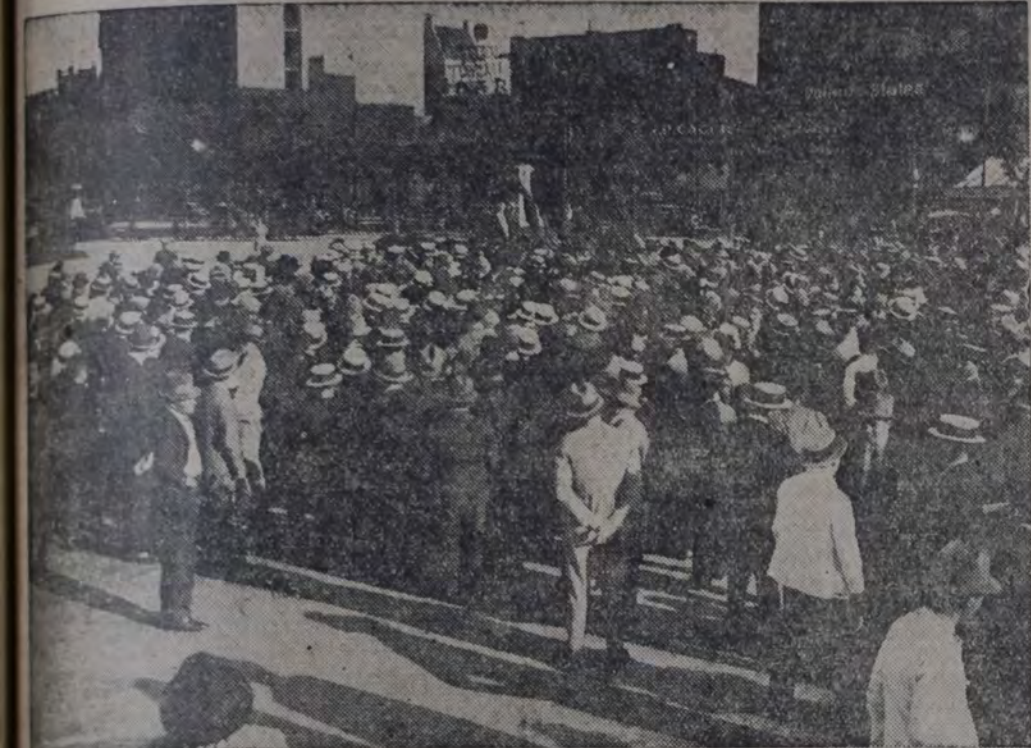
EL MITIN DE LOS CARPINTEROS EN LA PLAZA DEL CONGRESO

tración de sus fuerzas en la plaza Once. A las 17.30 se habían reunido en la parte oeste de la plaza unos mil a mil doscientos trabajadores, iniciándose poco después los discursos. Se improvisaron seis o siete tribunas, desde las cuales hablaron unos tras otros varios jóvenes oradores que, en general, terminaban sus discursos cuando ya no les quedaba voz para seguir hablando. Hasta bien entrada la noche esa parte de la plaza Once ofrecía un aspecto pintoresco: de un lado, los oradores, que gritaban a voz en cuello ante sus auditorios; del otro, grupos de obreros que discutían cuestiones propias del momento, en tanto que numerosos repartidores de volantes y folletos realizaban su trabajo.