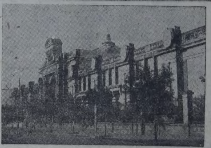
DE PARANA (E. RIOS), FUNCIONA EN EL HERMOSO Y COMODO EDIFICIO DE QUE DA CUENTA LA NOTA QUE OFRECIMOS.