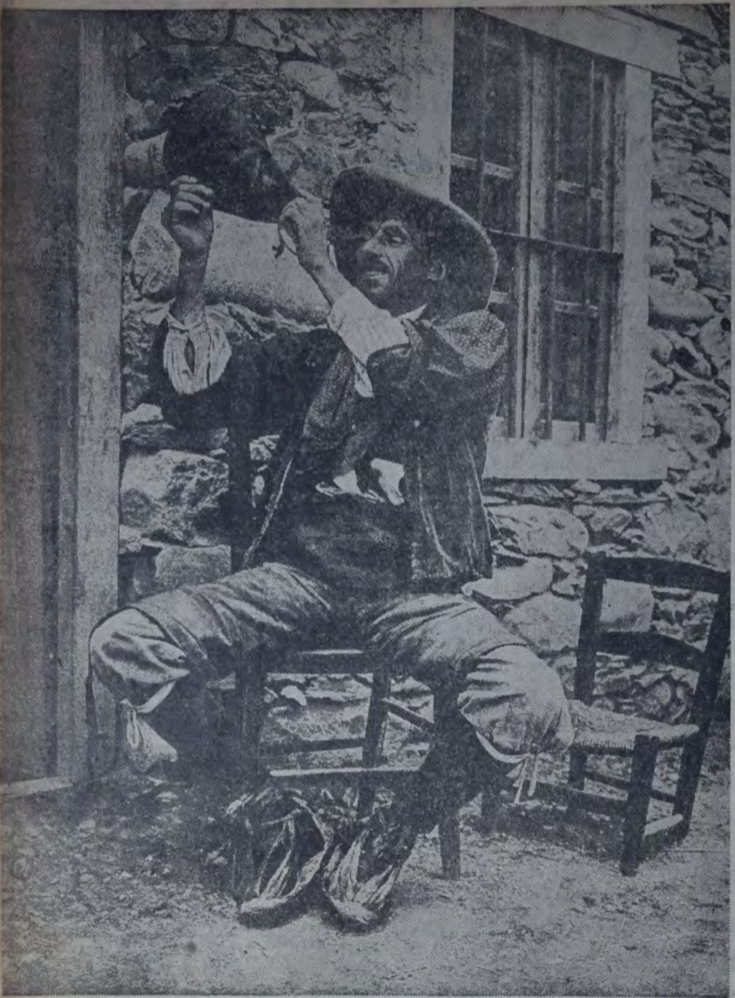
PERSONAS, PAISAJES, COSAS Y COSTUMBRES - UN CAMPESINO DE ARAGON BEBIENDO EN BOTA A LA MANERA CLASICA ESPAÑOLA.